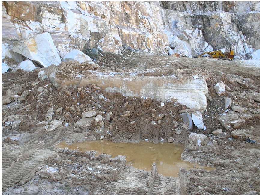
9. Σε πρώτο πλάνο η ράμπα φόρτωσης και στο βάθος ο φορτωτής.