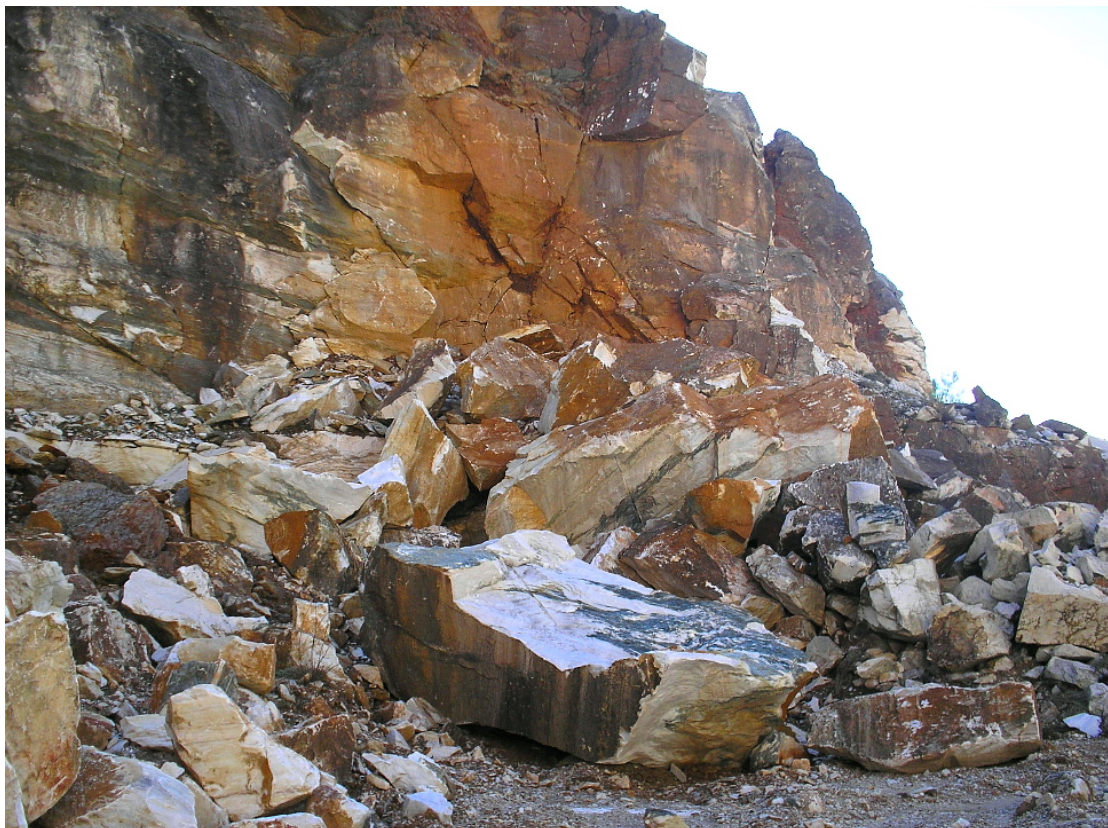
3. Το σημείο του αρχαίου λατομείου που έβαλαν τα φουρνέλα και οι όγκοι που αποκολλήθηκαν.