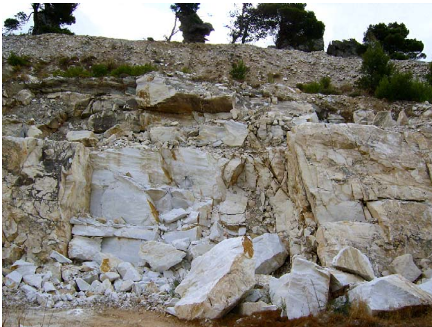
3. Αποψη του μετώπου, όπου έκαναν εσοχή ίδια με εκείνη στα Ελληνικά Μάρμαρα.