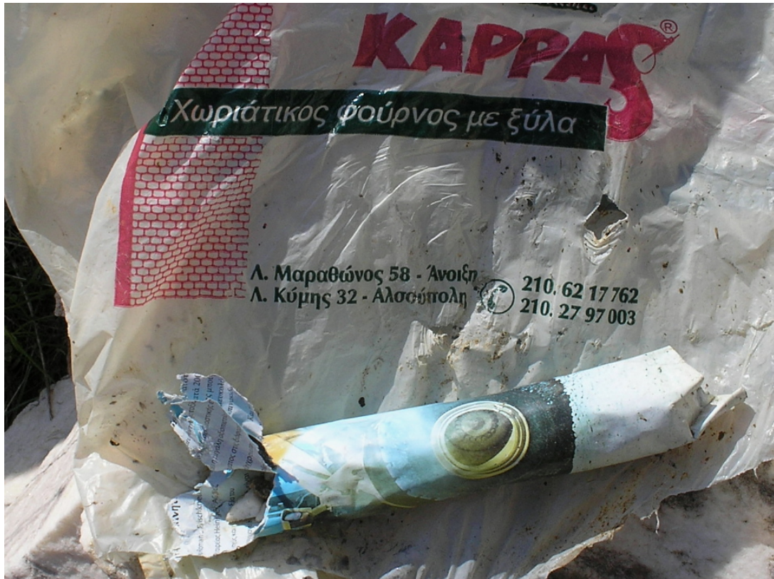
2. “Φυσέκια” που γεμίζουν με ψιλό γαρμπίλι για να στουμπώνουν τα φουρνέλα