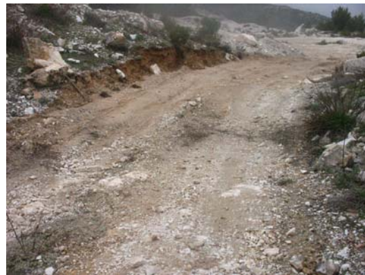
6. Η είσοδος στο νταμάρι του Χανιώτη πριν και μετά. Αφού έγινε η εξόρυξη, μεγάλωσαν το φάρδος της εισόδου ώστε να μπορεί να περάσει άνετα το φορτηγό και να φορτώσει τα ογκομάρμαρα.