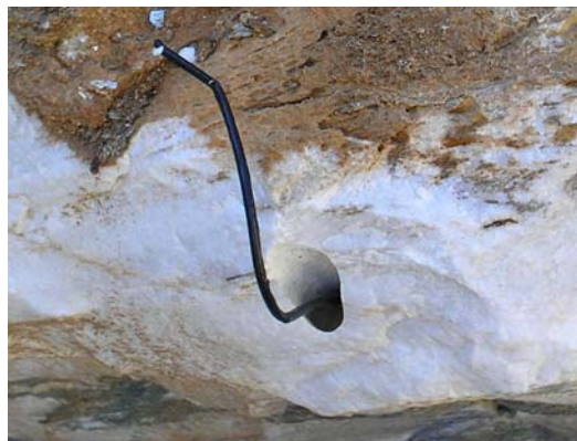
1. Φιτίλι που δεν κήκε