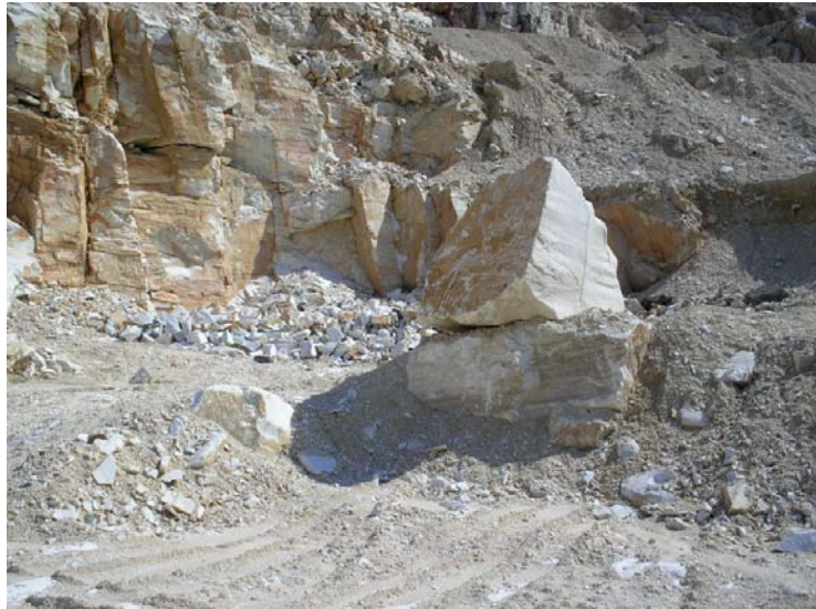
3. Όγκος πάνω στη ράμπα έτοιμος για φόρτωση.