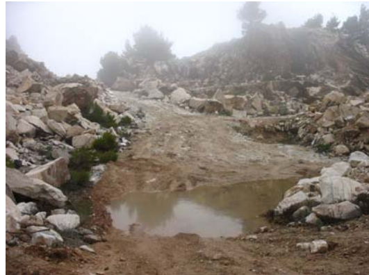
7. Εδώ φαίνεται η είσοδος και ο πυθμένας του λατομείου. Έστρωσαν παντού χόμα κάνοντας ευκολότερη την πρόσβαση για το φορτηγό. Στην αριστερή φωτογραφία, διακρίνεται ο τεράστιος όγκος τον οποίο φυσικά και πήραν.