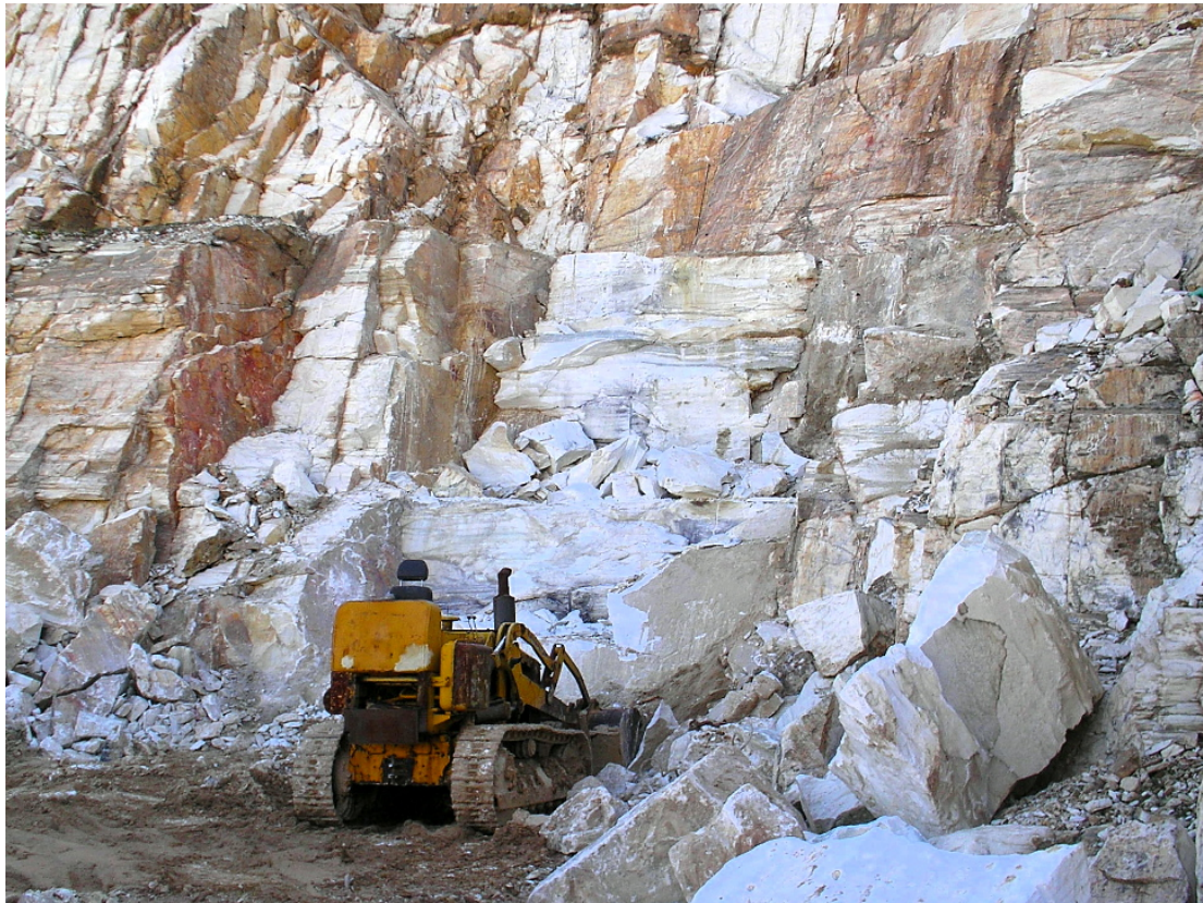
6. Μέτωπο 1 : Το μέτωπο εξόρυξης όπως είχε ύστερα από 1 μήνα εργασιών. Οι 4 μαυρίλες πάνω στο λευκό μάρμαρο είναι από το μπαρούτι που χρησιμοποιήθηκε στα φουρνέλα.