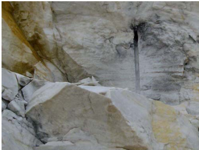
2. Η μαυρίλα από το μπαρούτι και η μακατιά δείχνουν το σημείο όπου έσκασε ένα από τα φουρνέλα.