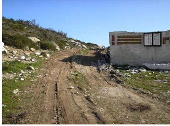
8. Πρόσβαση 1 και πρόσβαση 2. Επειδή τα Ελληνικά Μάρμαρα είχαν κλείσει με όγκους το δρόμο, άνοιξαν δικό τους πέρασμα πίσω από τα καλύβια.