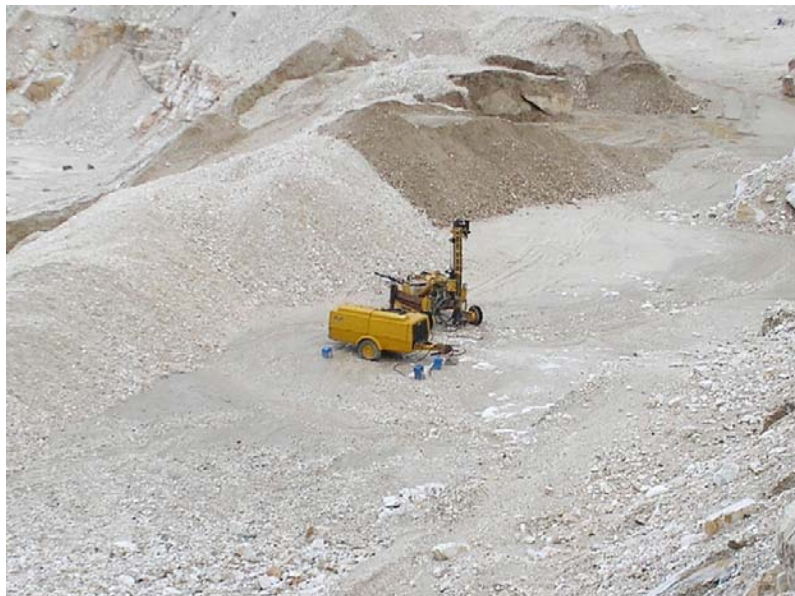
4. Το Wagon – drill που χρησιμοποιήθηκε το Γενάρη του 2006 για τα μεγάλης ισχύος φουρνέλα. Στο βάθος διακρίνονται όγκοι θαμμένοι στα μάζα. Τους σκεπάζουν προσωρινά για να μη φαίνονται.