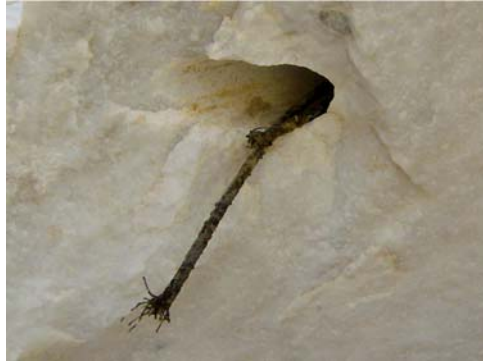
1. Υπόλειμμα φιτιλιού σε θραύσμα βράχου.