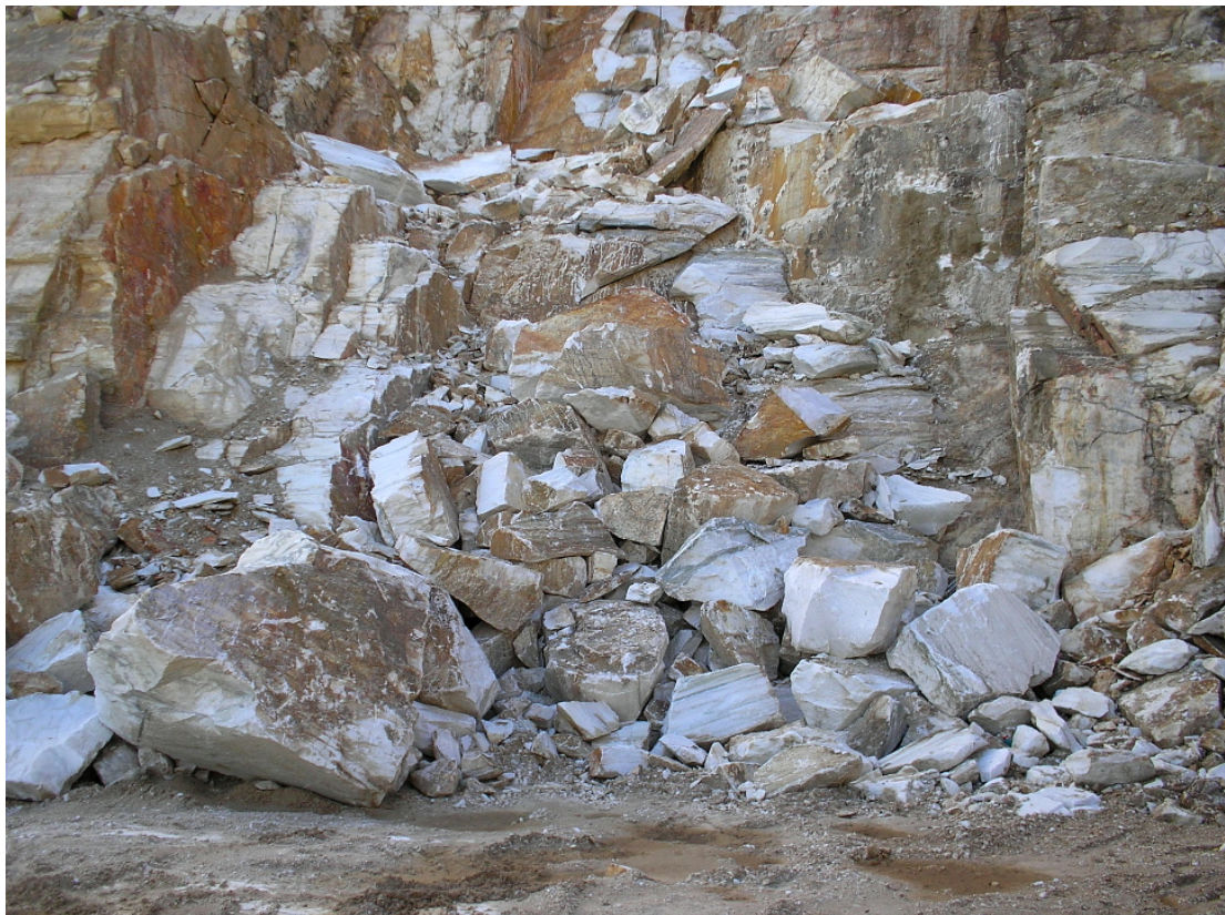
7. Μέτωπο 2 : Το μέτωπο εξόρυξης όπως είχε μετά την αποχώρησή τους 2 μήνες αργότερα.