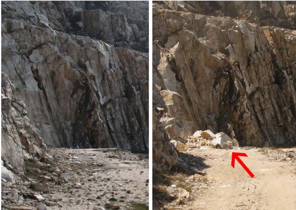
11. Το σημείο της εξόρυξης πρὶν και μετὰ. Με το βελάκι σημειώνονται οι όγκοι που κατέπεσαν.