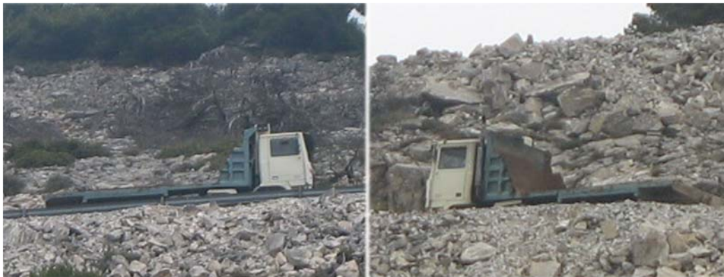
12. Το φορτηγό με την κομμένη καρότσα ενώ ανεβαίνει προς τα λατομεία. (10/2/07)