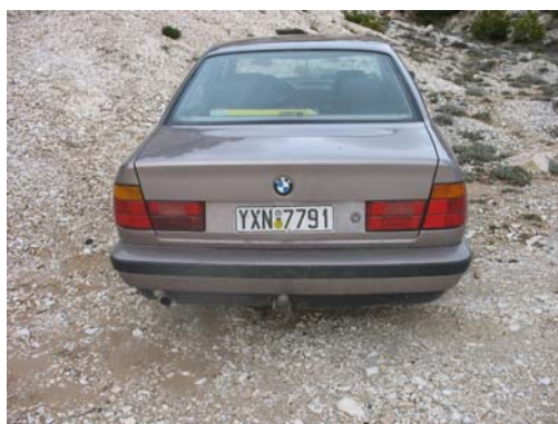
4. Το αυτοκίνητο του Ντέμου (2006)

Στις εξορύξεις που έκανε ο Ντέμος στο νταμάρι του Χανιώτη (ακριβώς πάνω από τη σπηλιά του Νταβέλη) χρησιμοποίησε για τη μεταφορά προσωπικού και εργαλείων ένα VW βαν (χρώμα κάπως σαν μπλε Αεροπορίας και κρεμ οροφή) ΥΥΧ 14(8)4 (το τρίτο υποθετικό νούμερο ίσως ήταν επίτηδες κατεστραμμένο). Στη συνέχεια έρχονταν και με το 4X4 ZHT 1405 (χρώμα πολύ σκούρο πράσινο, άσπρη οροφή).