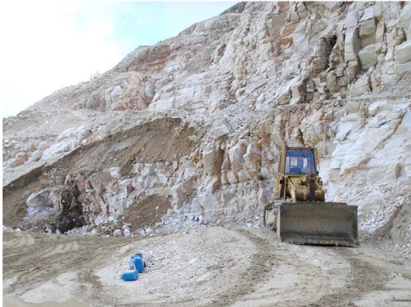
1. Ο φορτωτής Cat 963 που μετακινεί τους όγκους και τους φορτώνει στα φορητά.

Φωτογραφίες από την πολύχρονη παράνομη δραστηριότητα της εταιρίας στο λατομείο Ελληνικά Μάρμαρα, που εκμεταλλεύεται την άδεια για τη λειτουργία του σπαστηροτριβείου με τα παλιά στείρα υλικά και διενεργεί νέες εξορύξεις.