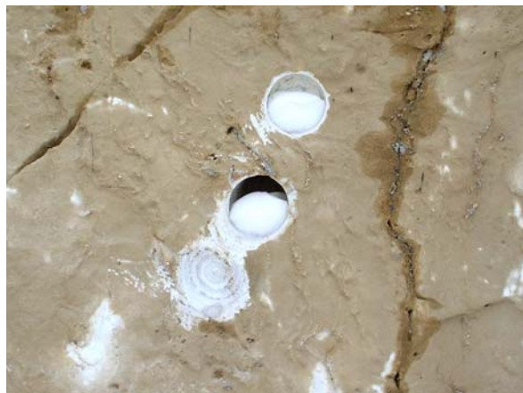
5. “Κοτσάνια” των φουρνέλων μετά τις εκρήξεις.