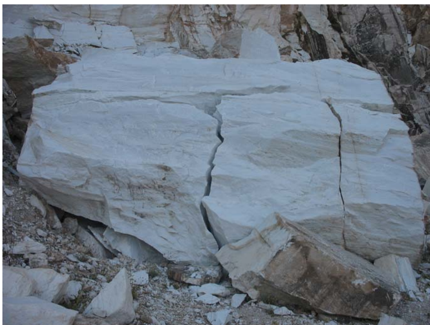
5. Ο φρεσκοκομμένος όγκος στο νταμάρι του Χανιώτη. Δεν βρίσκεται πλέον εκεί.

Το αυτοκίνητο εντοπίστηκε πρώτη φορά στο νταμάρι του Χανιώτη στις 14/4/97, όπου σε λίγες μέρες φόρτωσαν τους όγκους που είχαν κόψει το 1995. Επανήλθε στον Χανιώτη τέλη Μαρτίου 1999, όπου με φουρνέλα απέσπασε μεγάλους όγκους και ξαναεμφανίστηκε το 2006 για να πάρει όσους όγκους δεν έπεσαν.