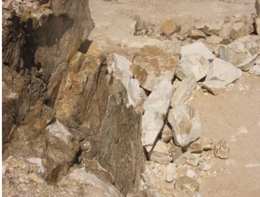
10. Απόψεις των εξορύξεων του Ντέμου στα Ελληνικά Μάρμαρα